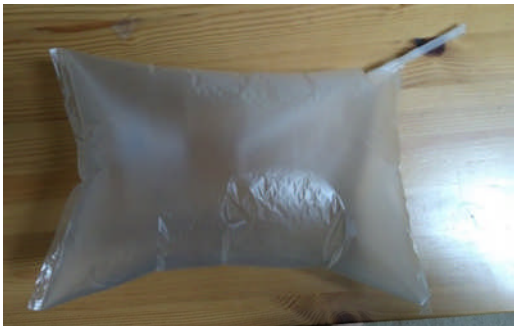
呼気を吹き込むと、袋はふくらんだ。ストローの口は、テープでフタをしている。