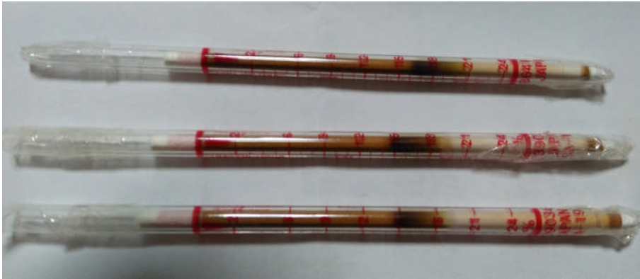
酸素検知管測定結果 上 室内空気 真ん中 成人男性 下 女子中学生