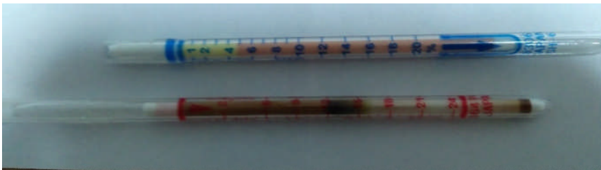
激しい運動をした呼気を測定した二酸化炭素検知管と酸素検知管写真