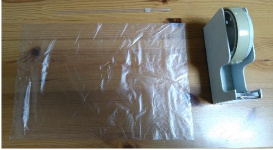
袋とストローとセロハンテープ