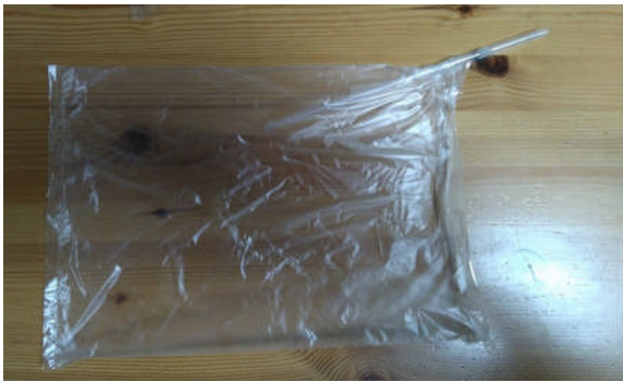
袋にストローを差し込み、テープで袋の開口部を閉じた。