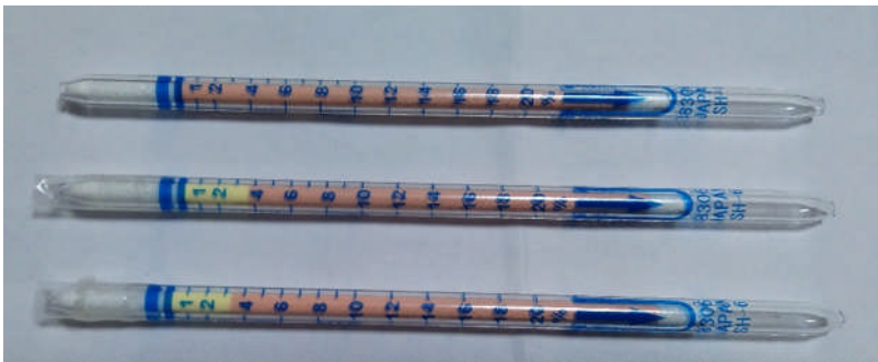
酸素検知管測定結果 上 室内空気 真ん中 成人男性 下 女子中学生