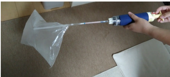
ストローに検知管を差し込んで、呼気を測定した。

『激しい運動』として成人男性がスクワット 60 回をした。その後の呼気を実験に使用した。