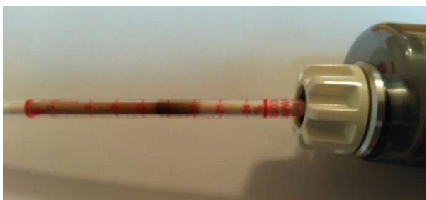
酸素測定中の検知管の写真

・激しい運動をした場合は、呼気中の酸素濃度は16%と低かった。また二酸化炭素の濃度は4.9%と高くなった。このことから、運動に多くの酸素が必要で、吐かれる二酸化炭素濃度が多くなることがわかる。